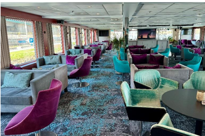
MS Nestroy, Barbereich