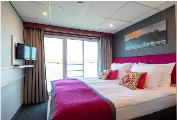
MS Nestroy, Doppelkabine Schiller- bzw Goethedeck