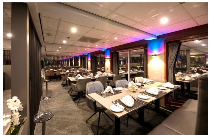
MS Nestroy, Restaurant