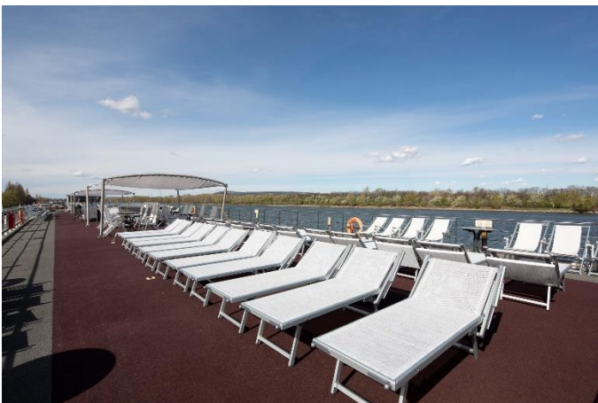
MS Nestroy, Sonnendeck

*Kat. E & F: keine Einzelbelegung möglich